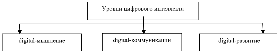
Рис. 1. Уровни цифрового интеллекта (по С. Умнову).

С. Умнов выделяет три уровня цифрового интеллекта: 1) digital-мышление (заключается в умении выделять информацию из потока, оценка адекватности источники); 2) digital-коммуникации (умение выстраивать сеть социальных контактов, взаимодействовать в новом формате); 3) digital-развитие (способность постоянно обучаться в онлайн-среде) [7]. Для большей наглядности они представлены на Рисунке 1.