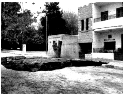
Рис. 1. Карстовый провал в пределах города Рас Аль Айн.

Результаты выполненных исследований. Карстовые деформации на участке г. Рас Аль Айн вызваны гравитационными и гидродинамическими перемещениями вышележащих пород в уже существующие полости, что весьма характерно для районов древнего карбонатного карста (рис. 1). Особого внимания для безопасности инженерных сооружений заслуживают