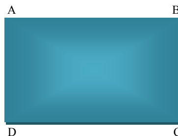
Նկ. 2: Ջրոսաշրջության կառուցվածքի համալիրի ձևավորման փուլերը. AB զբոսաշրջային ռեսուրսների օգտագործում; BC զբոսաշրջության կառուցվածքի ստեղծում; CD զբոսաշրջության կառուցվածքի գործունեության գիտական մեխանիզմի մշակում; DA զբոսաշրջության կառուցվածքի զարգացման գործունեությունը դեպի կայուն մարդկային զարգացման ուղղորդում:

Աշխարհագրական միջավայրի տարածքային կառուցվածքի մաս է կազմում նաև զբոսաշրջության օբյեկտը: Ջրոսաշրջության օբյեկտը, զարգանալով աշխարհագրական մտածողության չորս մոտեցումների հենքի վրա, ձևավորվում է այդ չորս փուլերով: Աշխարհագրական հետազոտության մոտեցումները և տուրիզմի զարգացման փուլերի միասնությունը պատկերված են նկ. 1–3-ում: