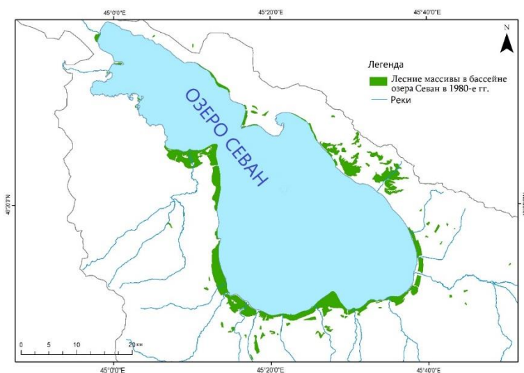
Рис. 1. Лесные массивы в бассейне оз. Севан в 1980-е гг.

Леса характеризуются низкой продуктивностью и не имеют промышленного значения. Максимальные показатели лесистости были в середине 1980-х гг., когда в лесной фонд были переданы насаждения, заложенные в 60–70-е гг. (рис. 1). В это время лесной покров в бассейне озера составлял около 14,5 тыс. га (топографическая карта Арм. ССР, масштаб. 1:100 000, 1982 г.).